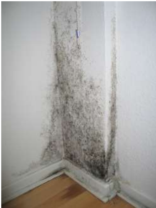
Schimmelbefall auf einer Wand

Dunkler Schimmelbefall wird auch von Laien schnell erkannt. Aber Schimmelpilzherde hinter Möbeln und Wandverkleidungen oder so genannte Stockflecken werden häufig übersehen oder für ungefährlich gehalten. Ob es sich um gesundheitsgefährdende Schimmelpilze handelt oder ob lediglich eine optische Beeinträchtigung vorliegt, lässt sich nur durch eine Untersuchung im Labor klären. Oft besteht ein Schimmelfleck auch aus mehreren verschiedenen Schimmelpilzarten.